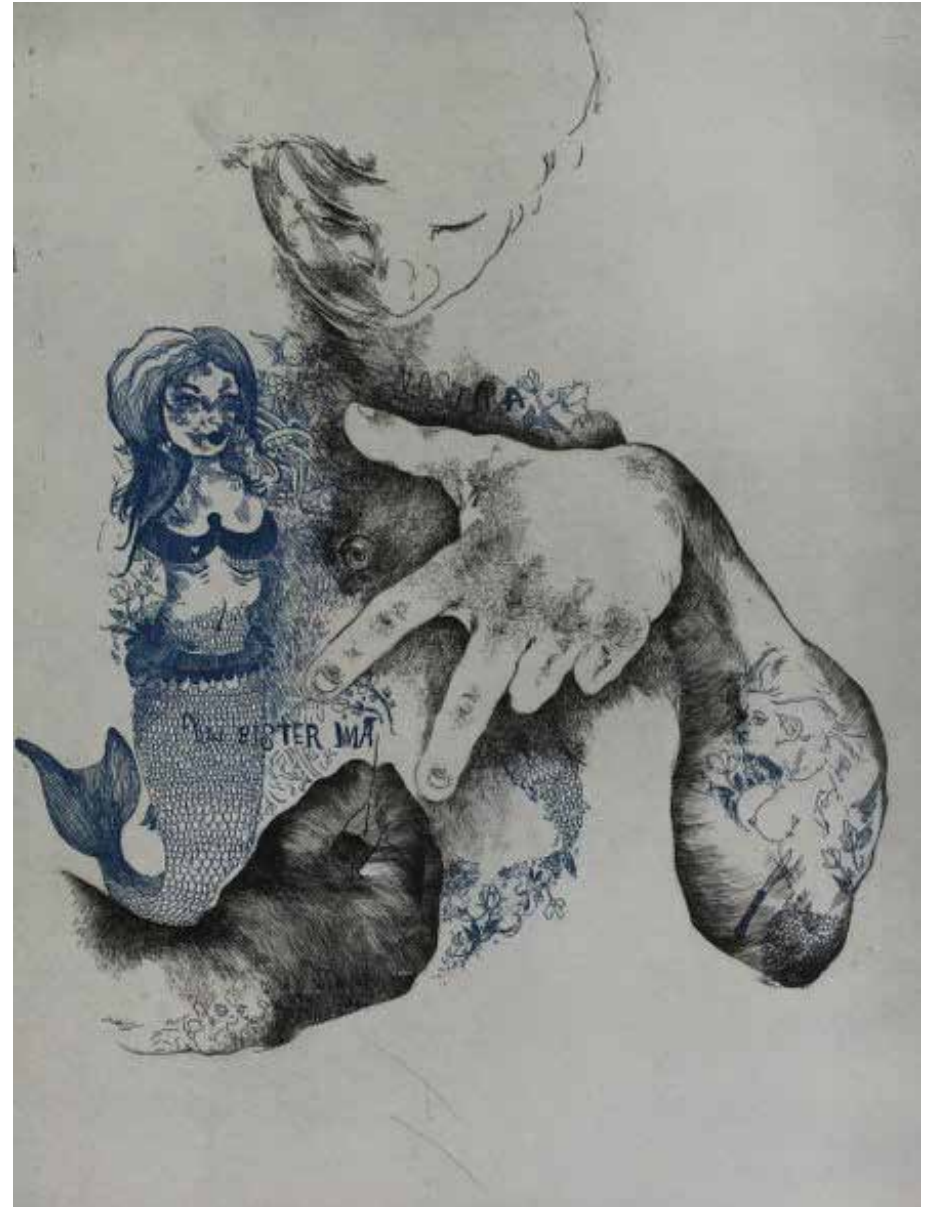
Nadikhuno muzeum / Neviditeľné múzeum, 2017