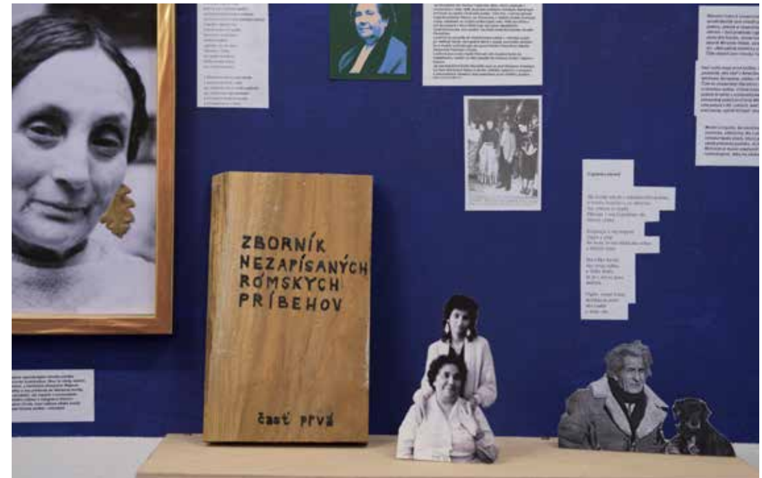
Nadikhuno muzeum / Neviditeľné múzeum, 2017

Preto je dôležité, aby IA MPSVR zväžila prijať rozhodnutie viesť svojich regionálnych koordinátorov k systematickej a profesionálnej spolupráci so zamestnancami dotknutých služieb a intervencií, najmä z projektu komunitných centier, koordinátormi osvedy zdravia v projekte Zdravé komunity a regionálnymi koordinátormi TSP/TP cez ÚSVRK.