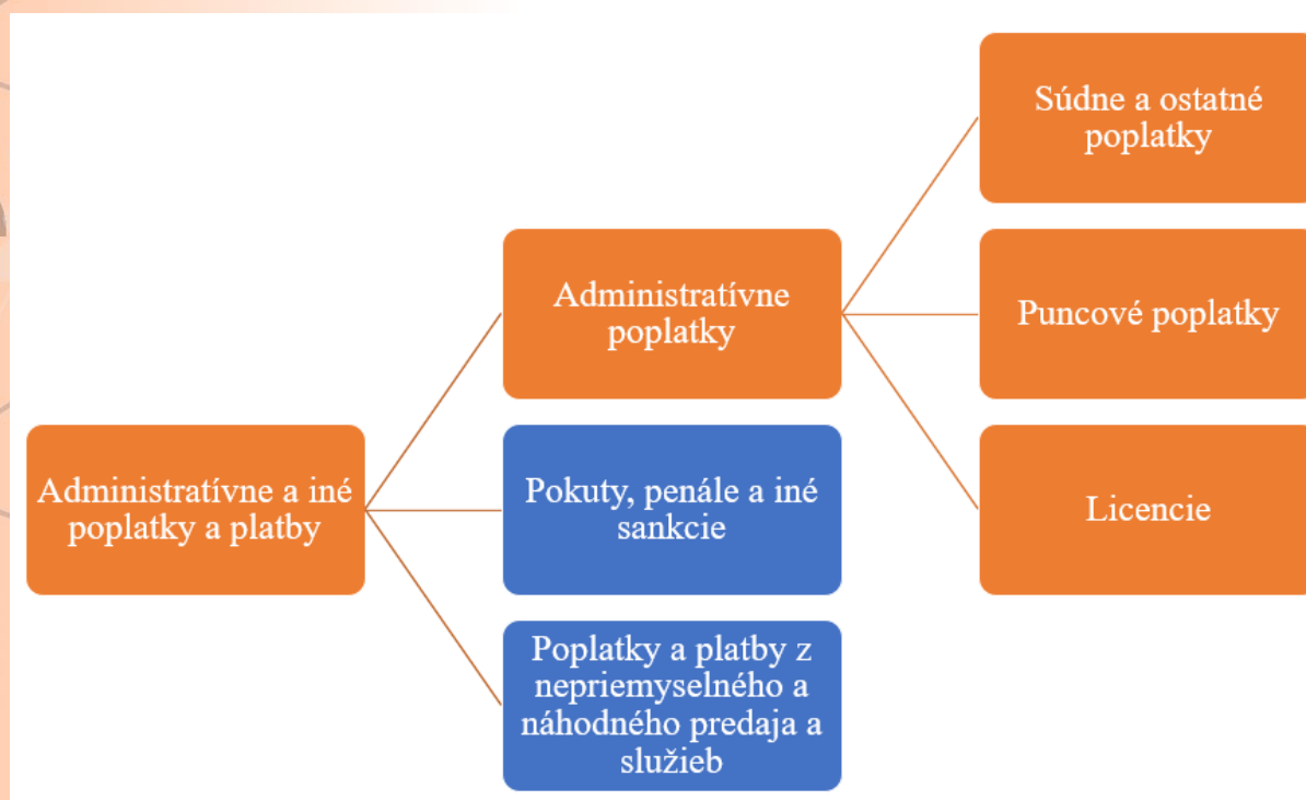
Obrázok 2 Kategória Administratívne a iné poplatky a platby