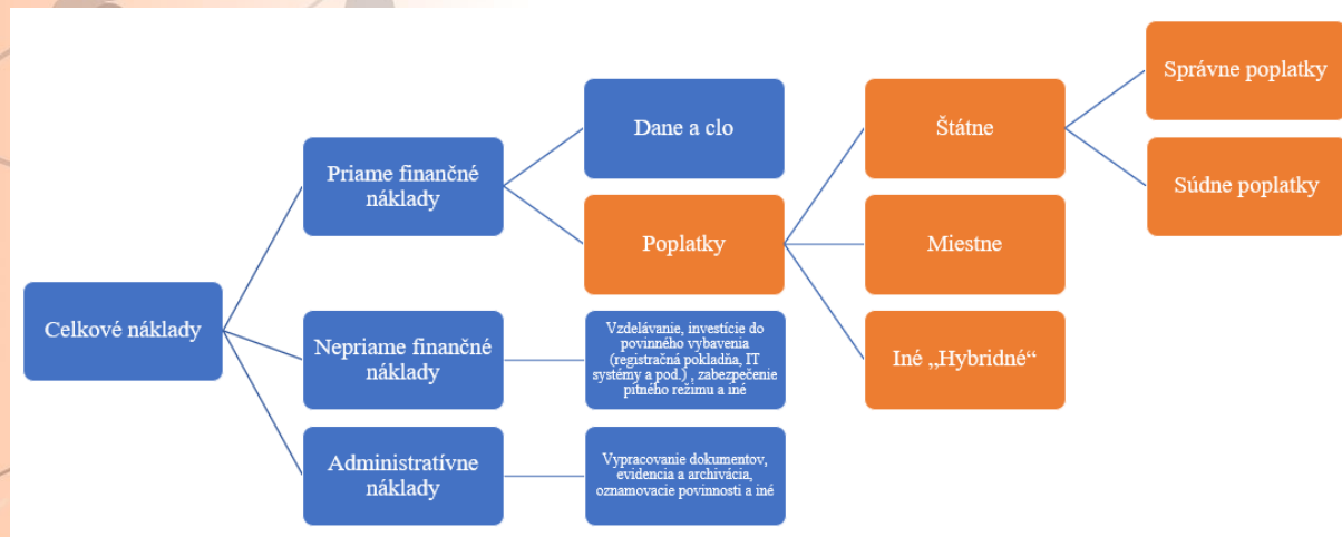
Obrázok 3 Rozklad celkových nákladov regulácie